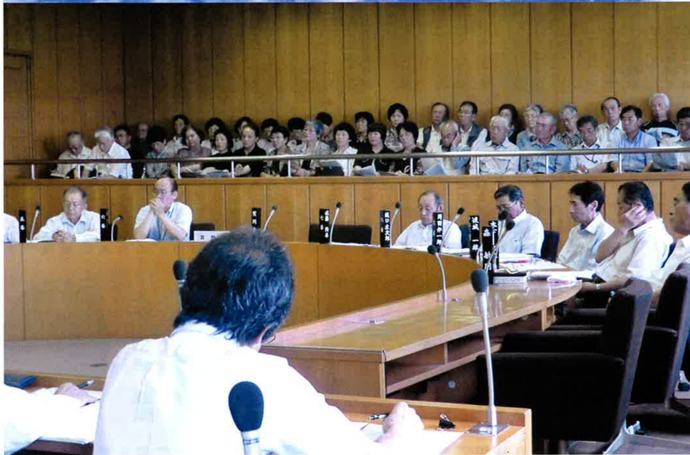
第2回定例会（多くの方に傍聴に来ていただきました）