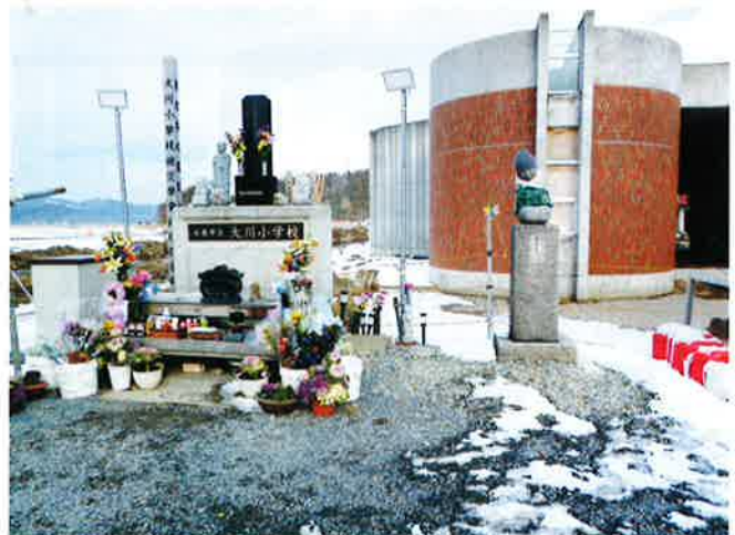
鎮魂碑が建立された大川小学校校舎 (宮城県石巻市)

被災地現場を視察中、多くの児童が亡くなった小学校に立ち寄り、視察者全員で鎮魂の碑にお参りをしましたが、言い表しようのない感情がこみ上げ、自然の脅威に対する人間の無力感を痛感しました。