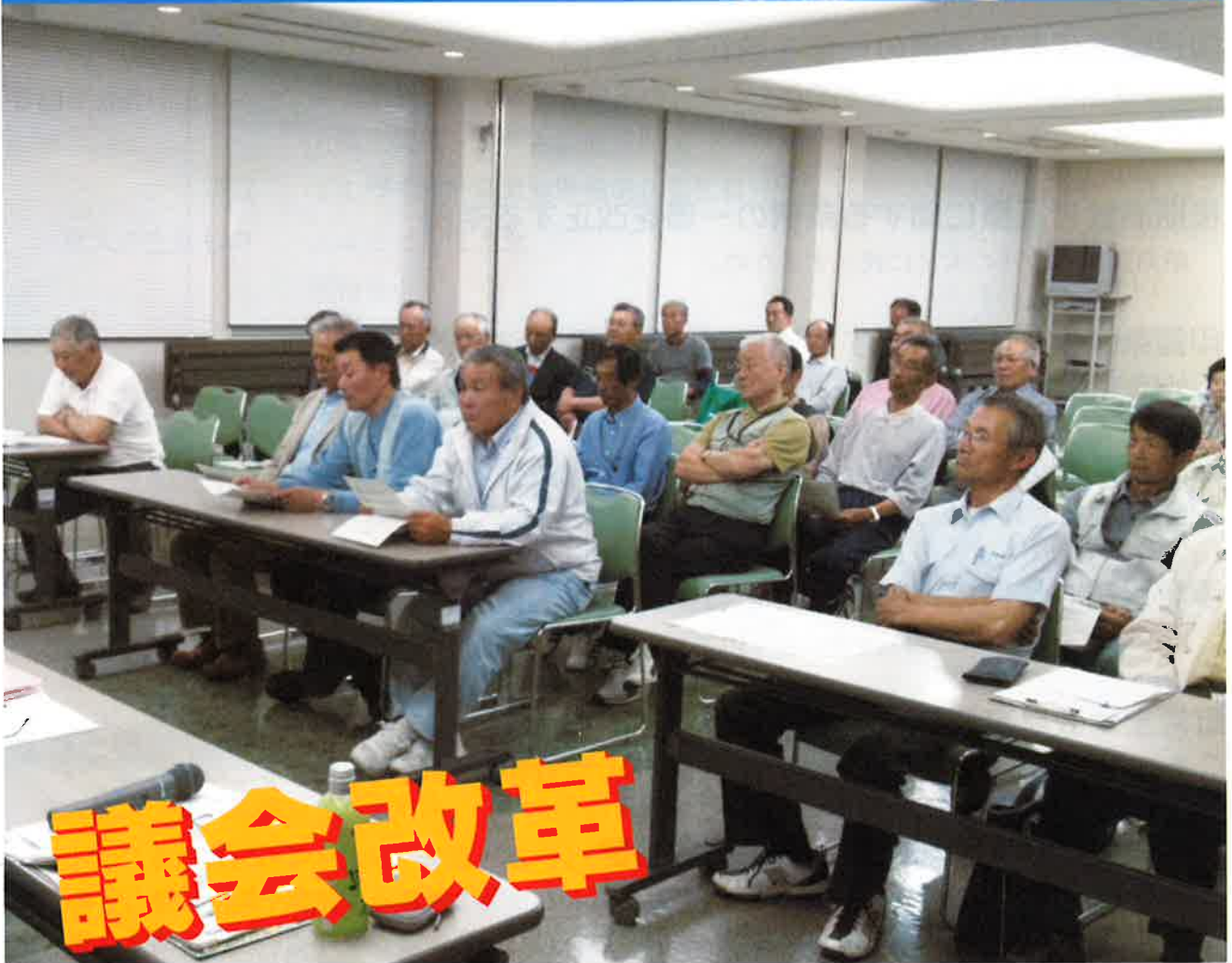
5月16日、18日の議会報告会の様子