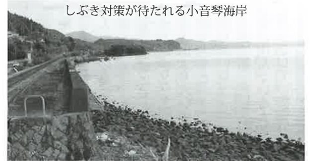
しぶき対策が待たれる小音琴海岸