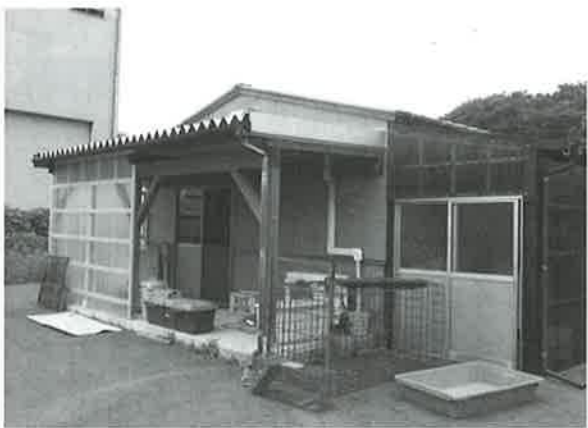
福岡県添田町の食肉加工施設