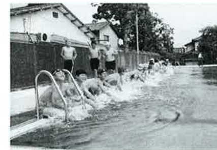
▲彼杵小学校プール完成