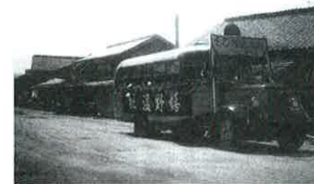
▲「そのぎ海水浴場」の宣伝カー