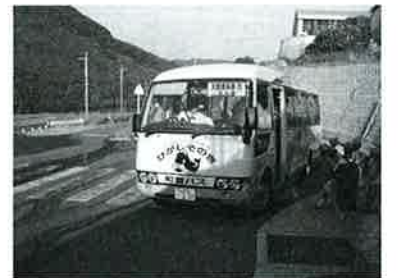
▲町営バスで通学する子どもたち