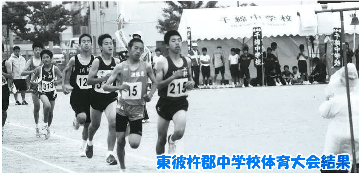
東彼杵郡中学校体育大会結果