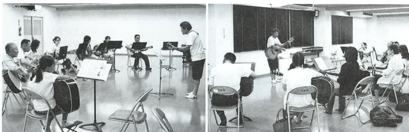
【フォークギター】 やさしいギターコードでフォークソングを歌います。(ギターをご持参ください。)

※迷惑メール防止のため、パソコンからのメールを拒否されている方は、ドメイン指定の解除をお願いします。