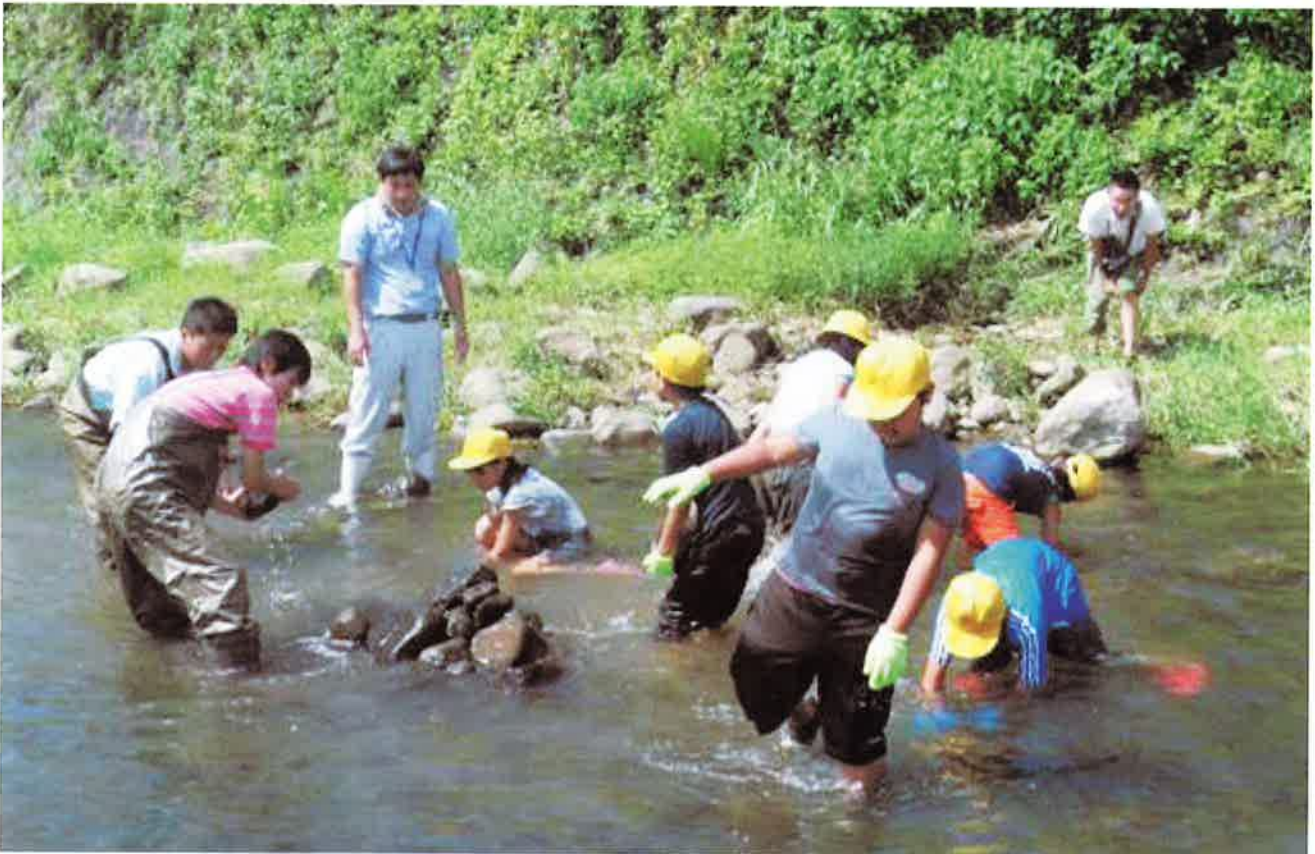
アユの産卵場所づくり

最後に総理大臣の5条件 見た目（女性に人気がある人）、言葉（政治家の命）、発信力、ぶれないこと、体力（精神的に）、運（自分で運んでくる）との講演でした。